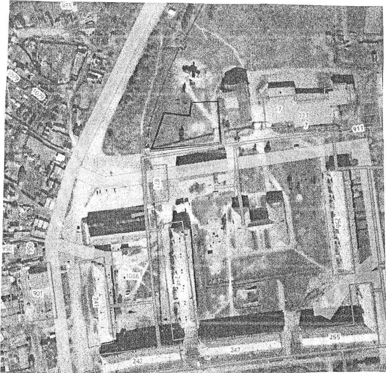
Схема территории проектирования в границах: южная — — п. Светлый земли неразграниченной госсобственности, западная — п. Светлый земли неразграниченной госсобственности, северная — п. Светлый здание церкви, восточная — п. Светлый Дом культуры